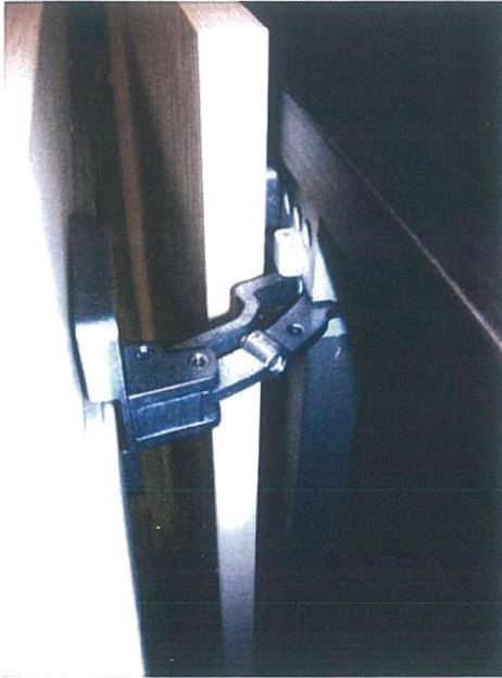
Vista meccanismo superiore

Denominaz. campione: Mobile con meccanismo per apertura/chiusura di ante complanari mod. "A-FIL"