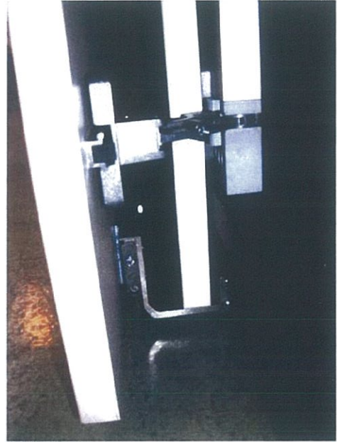
Vista meccanismo inferiore